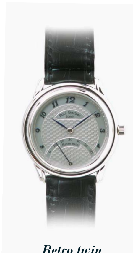
Retro twin 18. Kt. Weissgold, Ref. 157