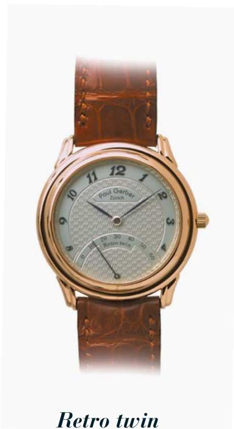
Retro twin 18. Kt. Roségold, Ref. 156