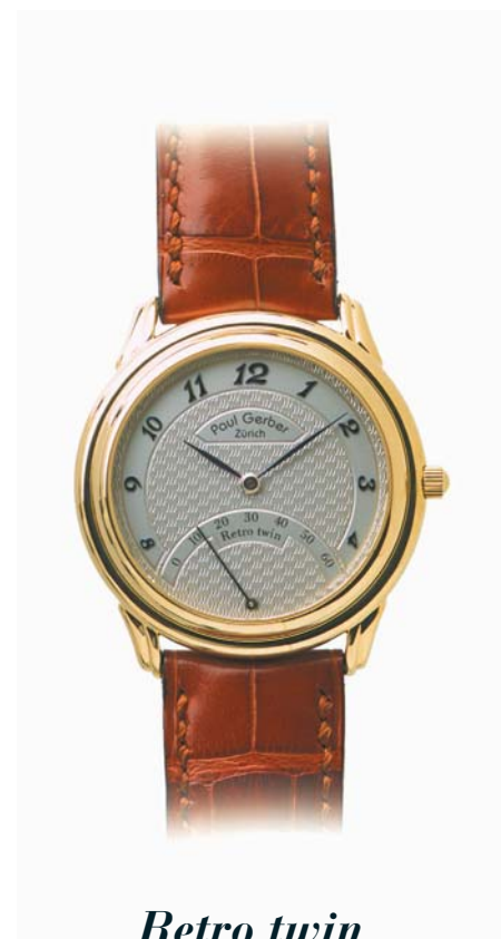
Retro twin 18. Kt. Gelbgold, Ref. 155