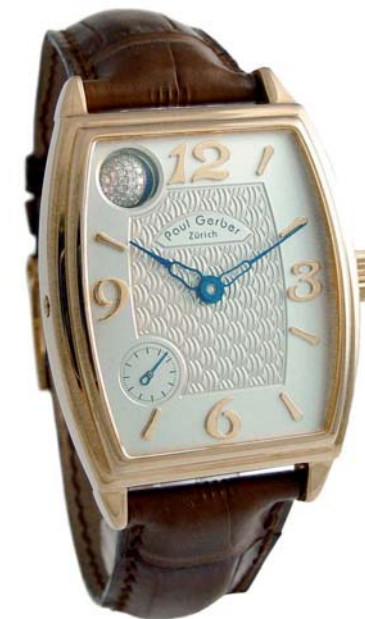
Modell 33 Dreidimensionaler Mond