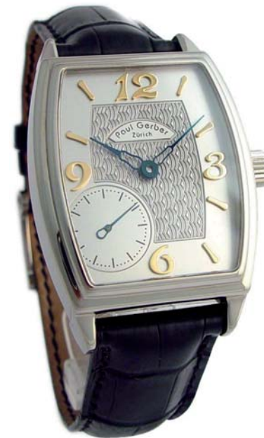
Modell 33 Grosse Sekunde